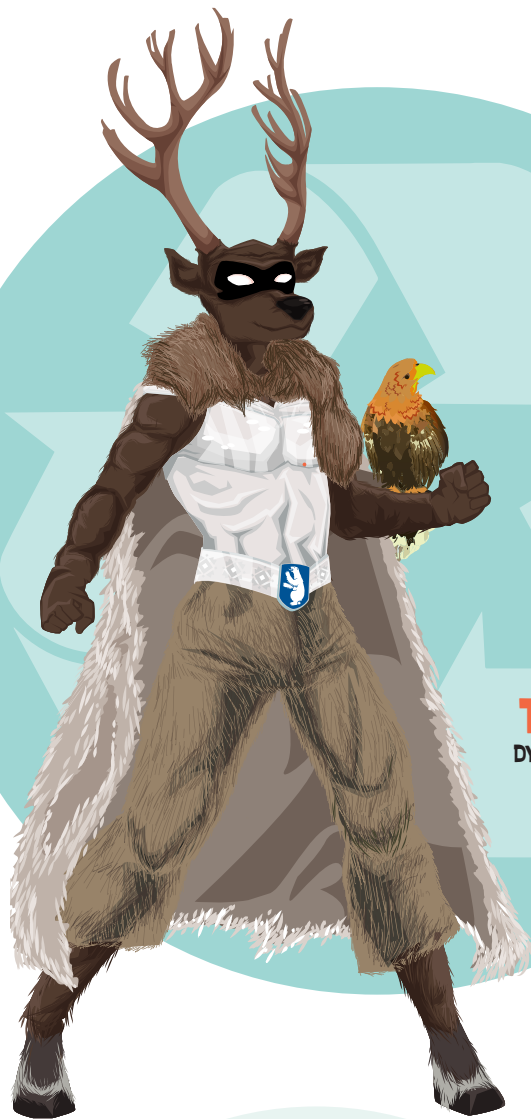
TUTTU DYRENES INUA

DYRENE GIVER FØDE OG LEVEGRUNDLAG TIL OS MENNESKER OG INDGÅR I NATURENS FØDEKÆDE. UUMASUT INUA KÆMPER FOR AT HOLDE DYRENESLEVESTEDER FRI FOR FORURENING OG FORSTYRRELSER.